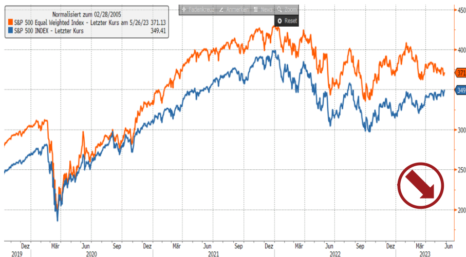
S&P 500 Equal Weight Index vs. S&P 500 Index

Eine bemerkenswerte Entwicklung vollzieht sich derzeit in der Marktbreite. Während der S&P steigt, fällt der gleichgewichtete Index zurück. Eine so starke negative Divergenz gab es noch nie. Allenfalls das Jahr 2007 reicht hier heran. Kein Wunder. Man bedenke, dass z.B. die Marktkapitalisierung allein der Apple-Aktie inzwischen die des Russell 2000-Index übersteigt. Von dem Gewicht einer Apple-Aktie gibt es knapp mehr als eine Handvoll. Die schwache Liquidität und die Attraktivität der Bonds führen dazu, dass nicht mehr alle Boote gehoben werden können. Das ist ein klares Warnsignal für die Aktienmärkte!