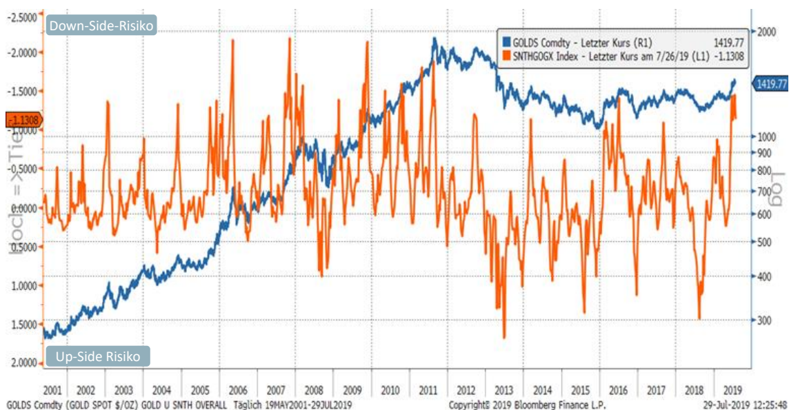
sentix Risikoradar: Risiko Gesamtindex für Gold und Goldpreis in USD

Bei Gold messen wir aktuell eine deutlich angespannte Risikokonstellation. Der Gesamt-Risikoindex für Gold beträgt -1,13 Standardabweichungen (im Chart invertierte Darstellung) und deutet auf Rückschlagrisiken hin. sentix analysiert regelmäßig fest definierte Bereiche aus dem Anlegerverhalten auf Risiken und bewertet diese systematisch nach mathematisch-statistischen Methoden. In nahezu allen Teilindizes des sentix Risikoradars für den Goldpreis sind „auffällige“ Werte zu verzeichnen. Das Sentiment ist überreizt, die technischen Oszillatoren allesamt überkauft. Zuletzt hat auch die Positionierung angezogen und die Anleger sind nun spürbar „long“. Eine Konsolidierung ist notwendig, um die Teilrisiken nach und nach abzubauen. Auf ein Ende der Gold-Hausse setzen die sentix Experten nicht: Da der Strategische Bias weiter stramm aufwärtsgerichtet ist, sollte der Grundtrend trotz Verschnaufpause nicht gefährdet sein.